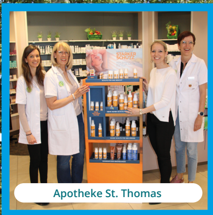
Apotheke St. Thomas