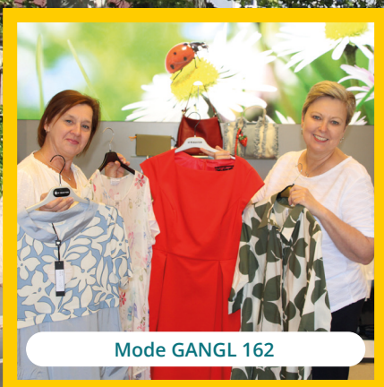
Mode GANGL 162